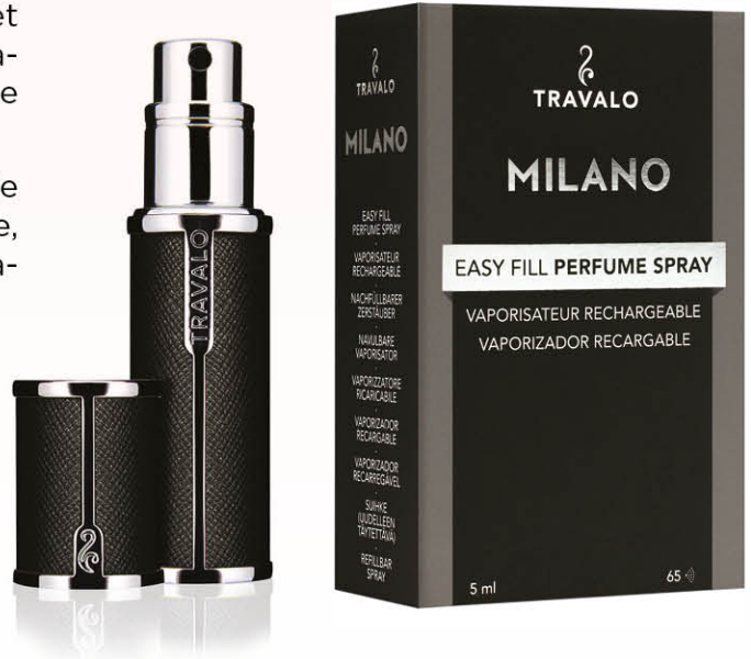
TRAVALO Milano Noir TM807N

Son système de recharge breveté est facile et rapide. Il est également interchangeable, vous permettant ainsi d'emporter votre fragrance du moment.