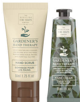
GARDENER'S HAND THERAPY SA00326 Produit vendu par 6