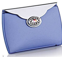
Envelope Strass mauve 8,5 x 6 cm 63112Y