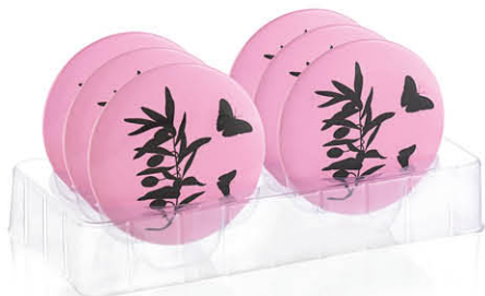
Présentoir 6 pièces 63431R