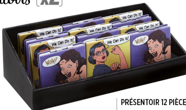
PRÉSENTOIR 12 PIÈCES Carré 7 x 7 cm 63807Z