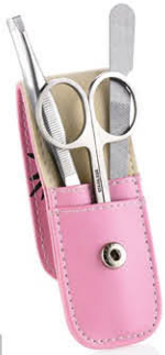
TROUSSE MANUCURE 3 OUTILS Motif papillon 75408R