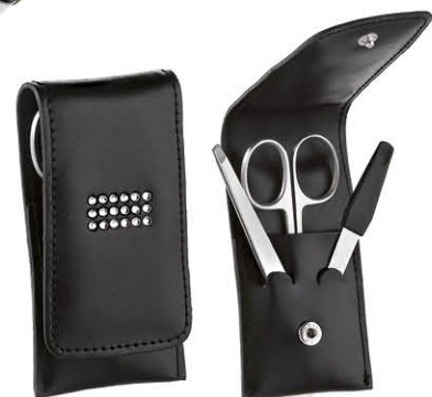
TROUSSE MANUCURE Cuir/strass, petit modèle Contient 3 outils 75859N