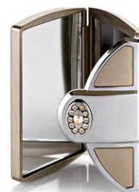
Envelope Strass taupe 8,5 x 6 cm 63040I