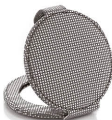
Rond Vichy Ø 8 cm Gris - 63228G Rouge - 63228R