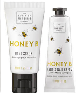
HONEY B SA00140 Produit vendu par 6