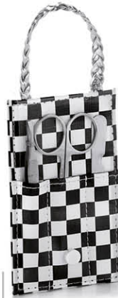
TROUSSE MANUCURE Contient 3 outils 75304M