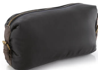
TROUSSE DE TOILETTE HOMME 75210N