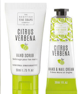
CITRUS VERBENA SA00388 Produit vendu par 6