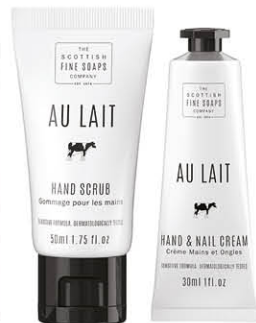
AU LAIT SA01634 Produit vendu par 6