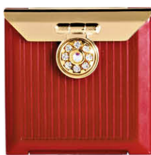
Carré Décor Strass 6 x 6 cm 63835P