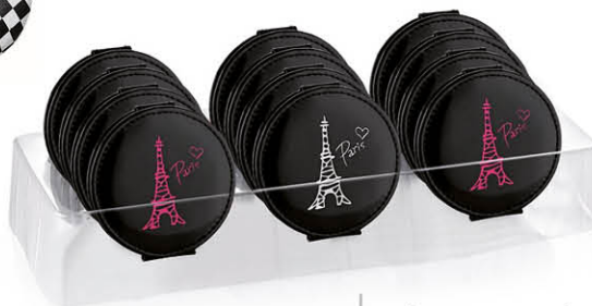
PRÉSENTOIR 12 PIÈCES Vinyl noir Tour Eiffel Ø 5,5 cm 63238Z