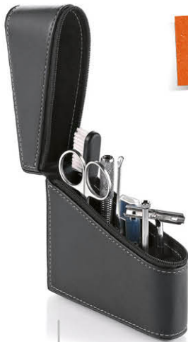
TROUSSE DE VOYAGE HOMME Contient 6 outils 75854N