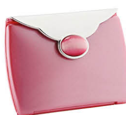
Envelope perle 8,5 x 6 cm 63712R