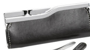
TROUSSE MANUCURE Étui glacé avec miroir Contient 2 outils 75752N