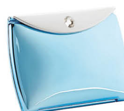
Envelope strass 8,5 x 6 cm 63710B