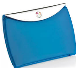
Envelope bleue 8,5 x 6 cm 63226B