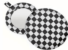
MIROIR Ø 10 cm 63315M