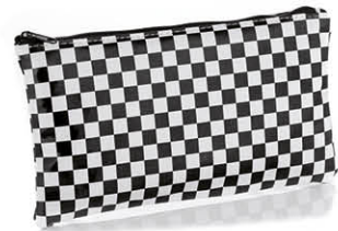
TROUSSE COSMÉTIQUE 22 x 12 cm 75303M