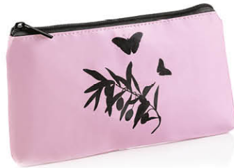
TROUSSE COSMÉTIQUE Motif papillon 75407R