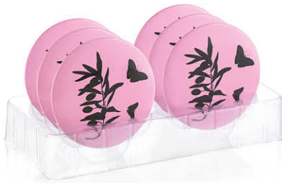
MIROIR DE SAC Motif papillon 63431R Produit vendu par 6